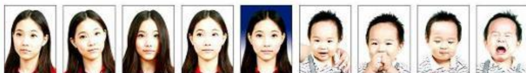
頭部側向 一邊、未 正視鏡頭 頭部傾斜 不正 頭髮遮蔽 到眼睛或 耳朵 眼睛未正 視鏡頭 背景色彩 不一致 出現其他 人的手 嘴巴被手 遮蔽 閉眼睛 表情不自 然、哭泣