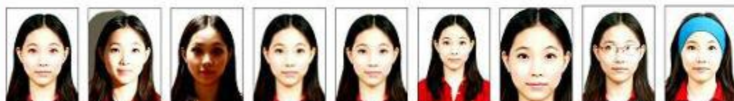
紅眼 背景有 陰影 臉部有 陰影 解析度 過低 模糊、對 焦不正確 頭部比例 過小 頭部比例 過大或頭 髮碰觸到 照片邊框 鏡片反光 臉部及雙 耳被物品 遮蔽