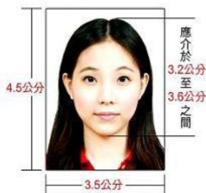
符合规格照片 (實際尺寸)