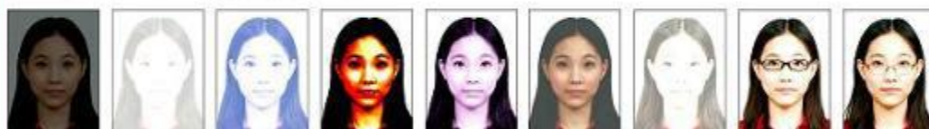
太暗 太亮 對比不足 對比太強 皮膚色調 不自然 曝光不足 曝光過度 配戴框框 眼鏡 鏡框遮蔽 到眼睛